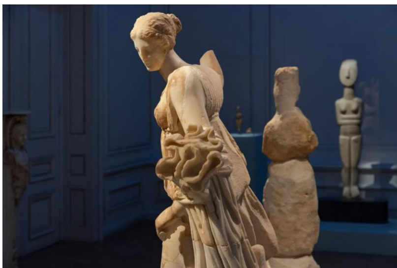
Γενική Άποψη της έκθεσης

● Κυκλαδίτισσες: Άγνωστες ιστορίες γυναικών των Κυκλάδων. (Kykladské ženy: Neznámé příběhy kykladských žen). Ministerstvo kultury prostřednictvím Státní správy pro kykladské památky a Muzea kykladského umění zorganizovalo archeologickou výstavu zmíněného názvu, která je předvedena v Muzeu kykladského umění v Megaro Stathatou. Katalog ve dvou svazcích představuje proměny a rozmanité role žen, které v průběhu času definovaly historii Souostroví. Trvání výstavy od 12. prosince 2024 do 4. května 2025.