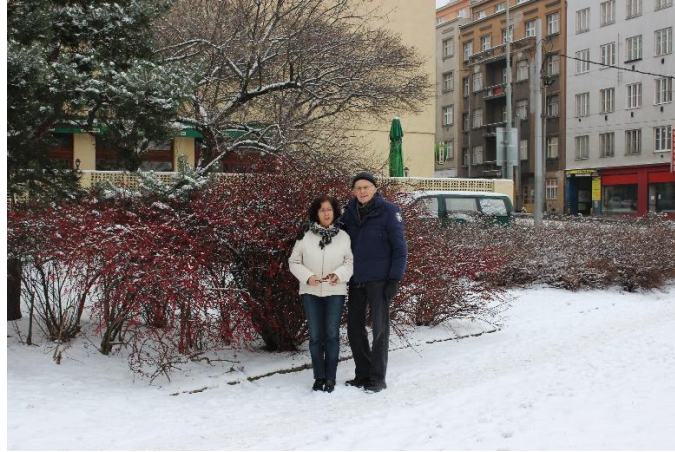
Vzpomínka na zasněženou Prahu před deseti léty. Μια ανάμνηση για τη χιονισμένη Πράγα πριν από δέκα χρόνια.

Vítáme členy Klubu přátel Řecka a čtenáře našich stránek v měsíci únoru, ve druhém měsíci nového roku 2025. Lidová pranostika říká: “Únor bílý, pole sílí.” Přejeme všem hezké prožití únorových dnů a pro milovníky lyží dost sněhů na lyžování.