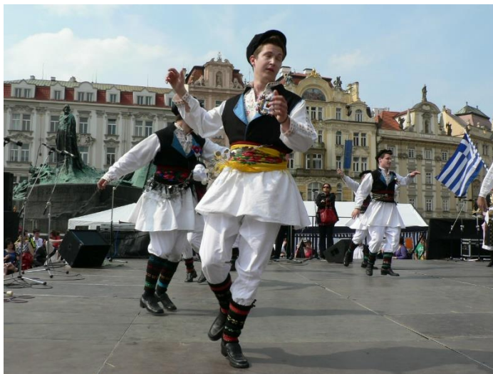
Ilustrační foto M. Konečný, 2010

Praha – srdce národů. Vyvrcholením letošního 26. ročníku bude Galakonzert v neděli 2. 6. 2024 v 19.00 v Divadle na Vinohradech. V tomto ročníku nás čekají bohaté programy a koncerty za účasti reprezentačních souborů v centru Pražského Starého Města.