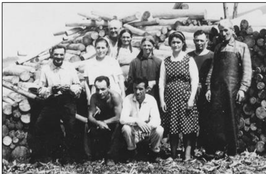
Řečtí zaměstnanci pily. Zlaté Hory.

Podle statistického přehledu k 15.12.1950 žili řečtí příslušníci ve čtyřech krajích (Hradec Králové, Olomouc, Ostrava a Brno) v celkovém počtu 7.393 osoby, dalších 86 osob bylo tehdy v léčebnách a sanatoriích. V 19 dětských domovech pro děti do 15 let byly umístěny 3.284 děti a 365 osob z řad pomocného personálu, učitelů a instruktorů. V 18 domovech mládeže bylo v učebním poměru 1.005 chlapců a dívek. V Praze žilo 60 řeckých příslušníků, pracovali v rozhlasu nebo studovali. Celkový počet řeckých příslušníků činil 12.193 osoby.