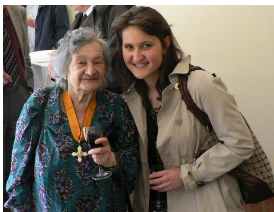
Prof. Růžena Dostálová s řádem Fénixe. 2011

Růžena Dostálová (22. dubna 1924 Bratislava – 18. srpna 2014 Praha). Panelovou výstavu k tomuto výročí „Růžena Dostálová 22. 4. 1924 – 18. 8. 2024“ iniciovala Česká společnost slavistických, balkanistických a byzantologických studií ve spolupráci s programem Novořecké filologie FF. Zájemci ji mohou navštívit do 28. června 2024 v Kabinetu pro klasická studia FLÚ AV ČR, Na Florenci 3, Praha 1.