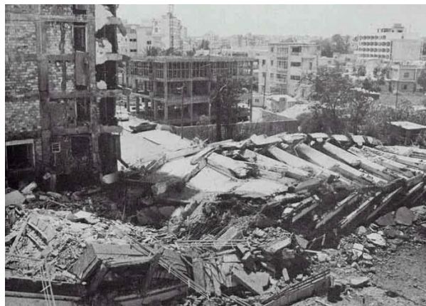
Βομβαρδισμός Αμμοχώστου, 1974 https://www.introneews.gr/stiles/storytelling/attilas-49-chronia-eisvoli/

V letošním roce si připomínáme 20 let od invaze Turecka na Kypr pod krycím jménem „Atilla“, která proběhla ve dnech 20. července až 18. srpna 1974.