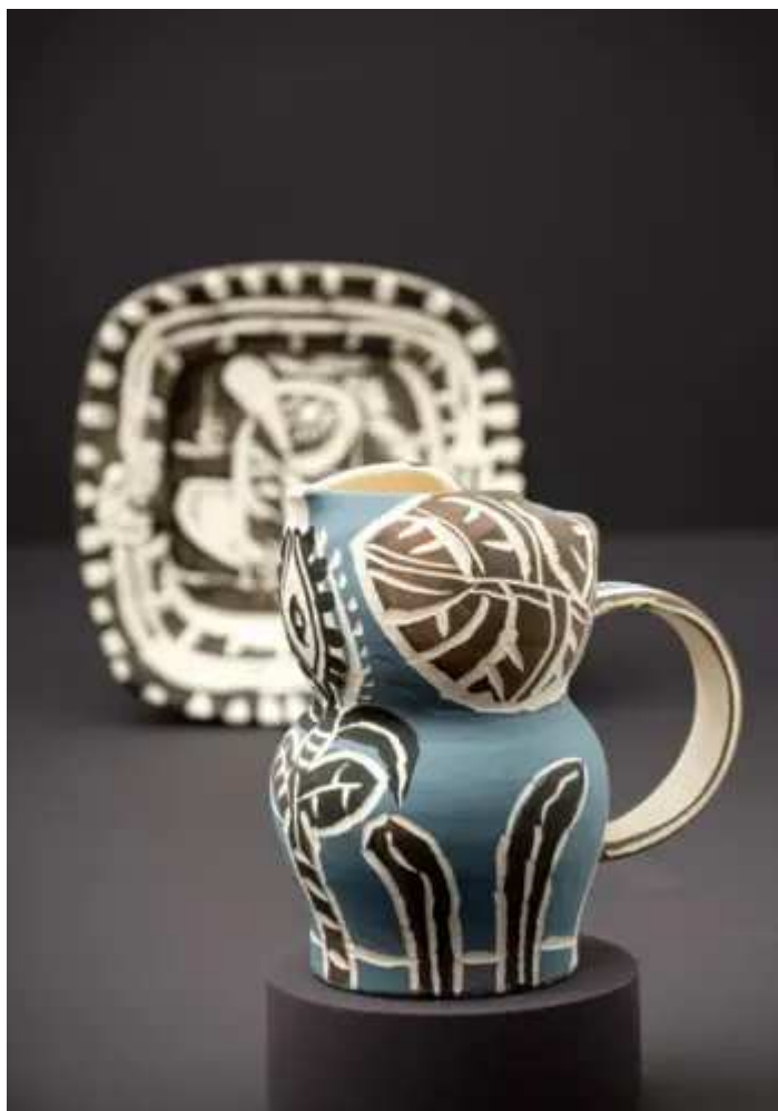
Pablo Picasso, Γότθικη κανάτα με φύλλα https://visitgreece.gr/el/events/exhibition/

ΜΟΥΣΕΙΟ ΕΛΛΗΝΙΚΟΥ ΠΟΛΙΤΙΣΜΟΥ. Με την ευκαιρία μιας νέας συνεργασίας ανάμεσα στη Βρετανική Πρεσβεία στην Αθήνα και το Μουσείο Μπενάκη, η Κυβερνητική Συλλογή Τέχνης του Ηνωμένου Βασιλείου με μεγάλη χαρά παραχωρεί σε καθεστώς μακροχρόνιου δανεισμού ΜΟΥΣΕΙΟ ΕΛΛΗΝΙΚΟΥ ΠΟΛΙΤΙΣΜΟΥ στο Μουσείο Μπενάκη Ελληνικού Πολιτισμού και στην Πινακοθήκη Γκίκα. Τα σημαντικά αυτά έργα από τον 19ο και 20ό αιώνα εντάσσονται στους χώρους των μόνιμων συλλογών και ακολουθούν τη θεματική της μουσειακής αφήγησης. Με τον τρόπο αυτό επιτυγχάνουν νέα και απρόσμενα συναπαντήματα και αναδεικνύουν τόσο τις κοινές ιστορίες όσο και τους ισχυρούς πολιτισμικούς και διπλωματικούς δεσμούς μεταξύ του Ηνωμένου Βασιλείου και της Ελλάδας.