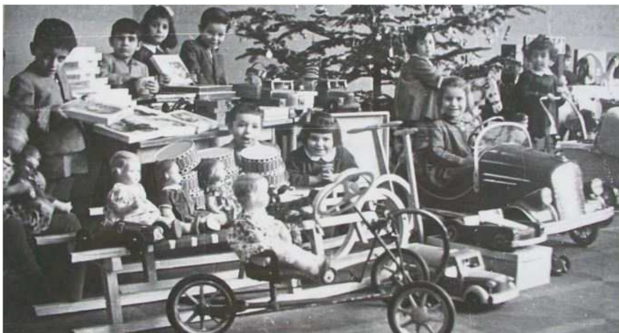
Vánoce řeckých dětí v Československu. DD Nové Hradý, 1951. In: Kalimera 5/22, s. 7.

zdravotních důvodů nepustila. Děti se těšily na nadílku, byly velmi zvědavé na Mikuláše a čerta, kterému říkali likos. Ředitelka měla obavy, zda se nebudou děti masek bát, ale dopadlo to výborně, Mikuláše děti ani nevnímaly, hltaly očima čerta, několik odvážných mu podalo ruku. Děti věřily, že Ježíšek přijede ve zlatém voze a donese strom. O Štědrém dnu, dopoledne i odpoledne, bylo v domově nezvyklé ticho, ředitelka měla dojem, že je zde klášter, jak byly děti náhle způsobilé. Zaměstnanci domova se postarali o krásné ustrojení vánočního stromku, sahajícího až ke stropu. Děvčátka si přála kuklu, tedy panenku, chlapani toužili po puškách. Díky Československé radě žen z Prahy-Podolí dostala všechna děvčata svou panenku, na každého chlapce bylo pamatováno hračkou. Mimo hraček, cukroví a ošacení dostal domov pro děti ještě 1.000 Kčs, za které ředitelka nakoupila všem klukům pušky. Za dar od neznámého koupila Betlém, který se těšil velké pozornosti dětí. Rada žen z Poděbrad zaslala domovu 30 gumových míčků. Do každé ložnice zakoupila ředitelka dětský telefon, ke kterému měly děti velikou úctu, snad proto, že se domnívaly, že mají spojení s Ježíškem. Počátkem ledna už ani jedna hračka nebyla celá, ale telefony stály nepoškozeny, protože se každý večer před spaním telefonovalo Ježíškovi, jak které dítě bylo za den hodné.