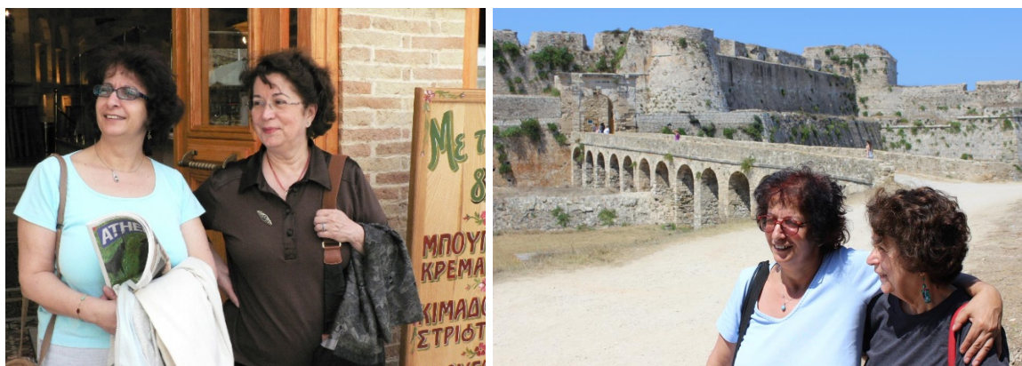
Přátelská setkání jsou nezapomenutelná. Οι φιλικές συναντήσεις μένουν αξέχαστες.

jako hudba, v noci, vzdálené, doznívající.